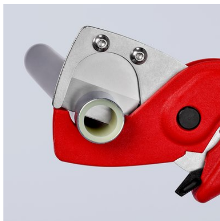
La lame tranchante à haute résistance coupe les tubes multicouche set en plastique sans à-coups et sans bavure