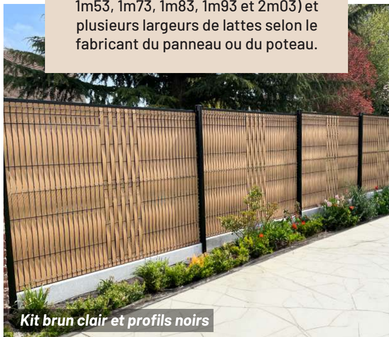
Kit brun clair et profils noirs

Afin de s'adapter parfaitement à votre clôture, nos kits existent en plusieurs hauteurs (1m03, 1m23, 1m53, 1m73, 1m83, 1m93 et 2m03) et plusieurs largeurs de lattes selon le fabricant du panneau ou du poteau.