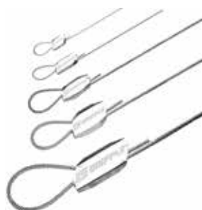
Câbles de suspension rapide