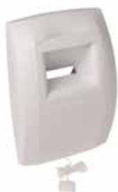
BOUCHE C34 BAHIA cordelette

La bouche BAHIA CURVE L est une bouche hygroréglable à destination de la cuisine permettant de garantir l'extraction suffisante et permanente des pollutions intérieures en fonction du taux d'humidité dans la pièce.