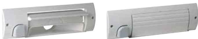
Plinthe ramasse-miette blanc - volet ouvert

La solution discrète pour évacuer les poussières d'une cuisine ou d'une entrée.