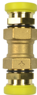
CALIBRE ÉQUIPÉ DU SYSTÈME CLAP