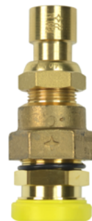
CALIBRE ÉQUIPÉ DU SYSTÈME CLAP